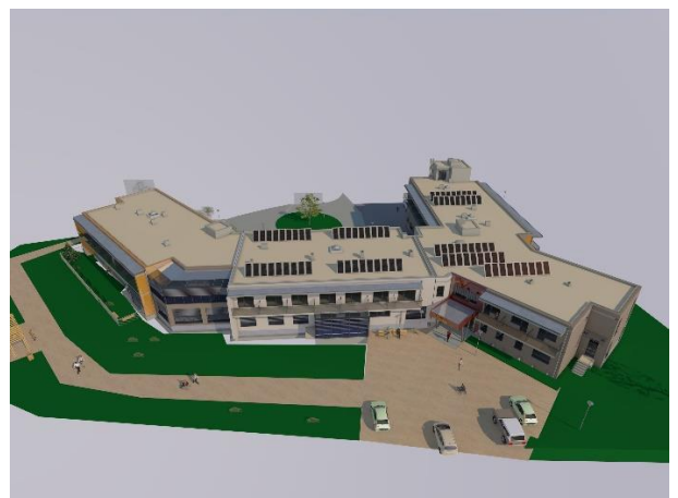
Centar za starije osobe Grubišno Polje